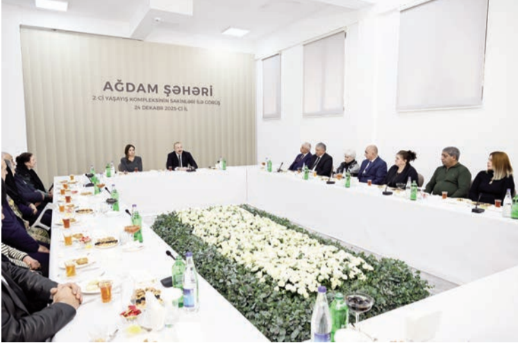
(Əvvəli 3-cü səhifədə)

Ona görə biz son 5 ildə ordu potensialımızı böyük dərəcədə gücləndirmişik və keçən ay hərbi paradda bütün dünya bunun bir hissəsini görə bildi